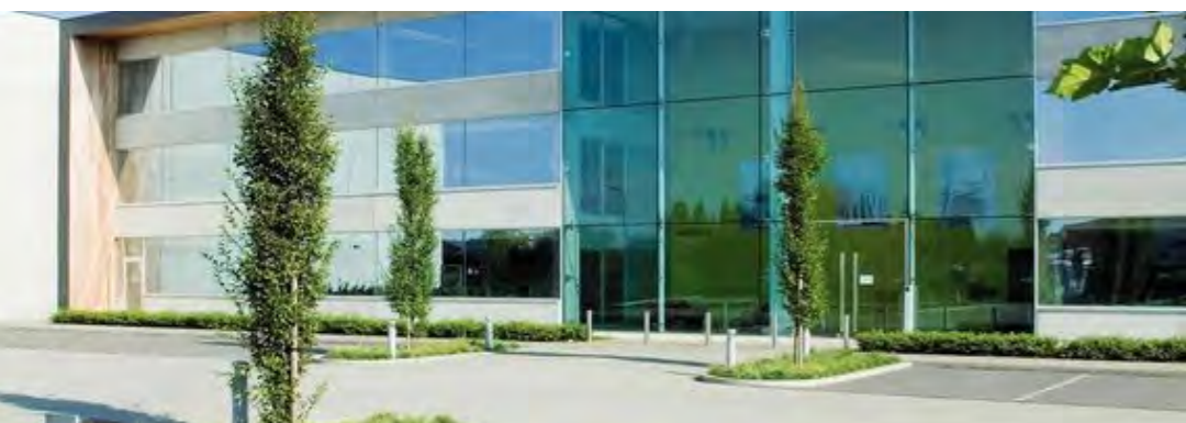
Mistral Home levert al jaren met succes aan grote retailers

Het bedrijf ging daarvoor op zoek naar nieuwe tools en kwam uit bij Organi. Het inschakelen van Organi's ERP en financiële software, met RF-scanning en real-time voorraadinzicht, had dan ook meteen een merkbare impact op de efficiëntie en bedrijfsprestaties van de organisatie.